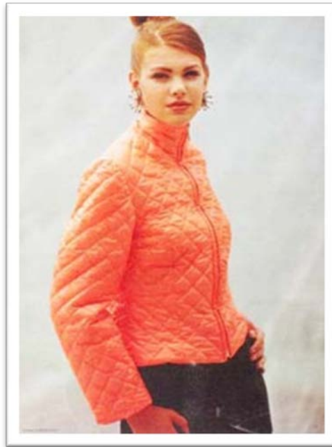
Década de 90