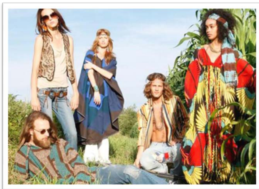
Década de 70