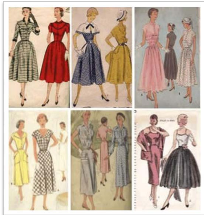
Década de 50