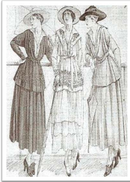
Década de 10