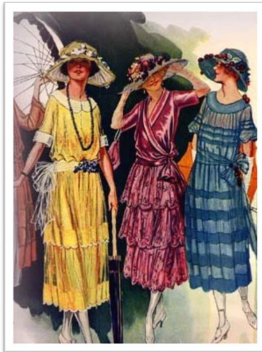
Década de 20