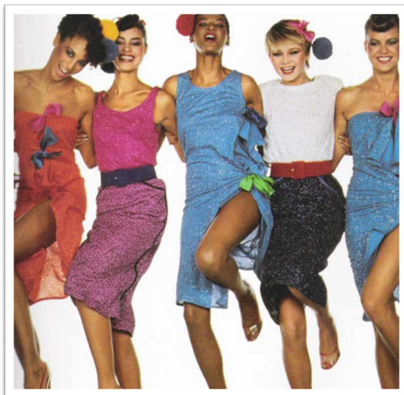
Década de 80