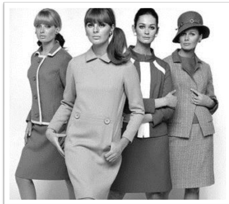
Década de 60