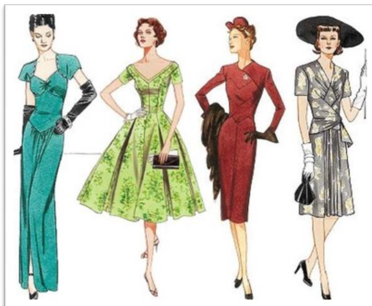
Década de 40