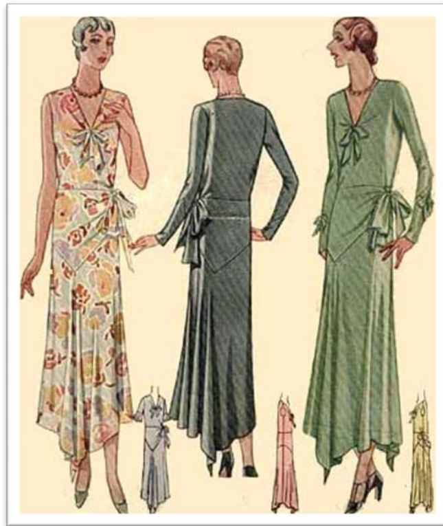
Década de 30