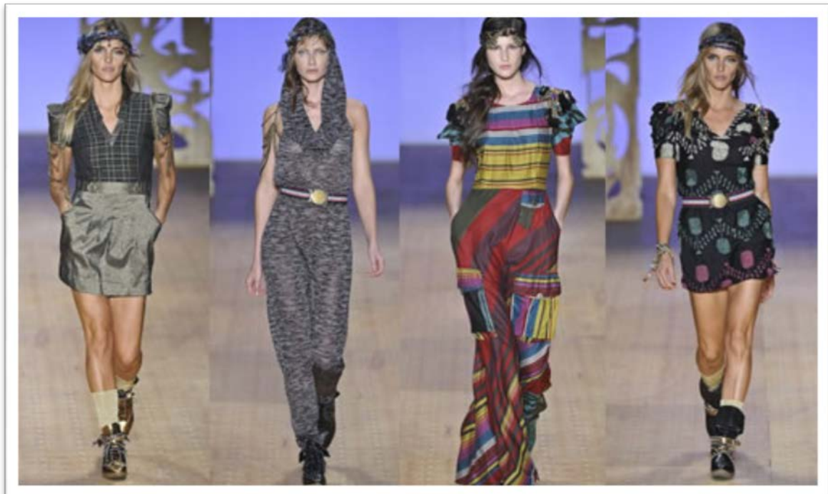
De 2000 A 2011